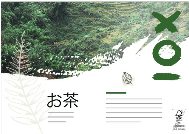
Emplacement du label FSC® : verso, en bas à droite

Exemple pour A3 (420 x 297 mm) horizontal